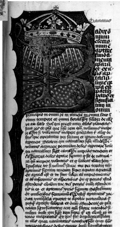
Рис. 3. Иллюминированная заглавная буква “R”, составленная из дерева, увенчанного короной, и золотого дракона (Guido Bonatti. Decem tractatus astronomiae // Arundel MS. 66. F. 129. British Library. The Catalogue of digitized manuscripts of British Library. URL: https://www.bl.uk/catalogues/illuminatedmanuscripts/ILLUMIN.ASP?Size=mid&IllID=56555 (дата обращения: 26.08.2019))

Отдельного внимания заслуживает миниатюра, изображающая самого короля Генриха VII (рис. 5). На первый взгляд, это довольно типичная презентационная миниатюра, однако если обратиться к ее детальному рассмотрению, это не совсем так. Во-первых, само изображение находится в манускрипте не в начале самого трактата Гвидо Бонатти, а лишь открывает одну из его частей – «О полном обороте Земли в течение года» (“Tractatus de revolutionibus”). Такое положение миниатюры далеко не случайно. Согласно астрономическим представлениям того времени после полного оборота Земли и в момент начала нового года с появлением