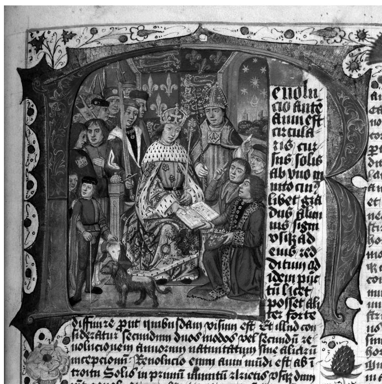
Рис. 5. Миниатюра с изображением короля Генриха VII, встречающего французского посла (Guido Bonatti. Decem tractatus astronomiae // Arundel MS 66. F. 201 ; Arundel MS. 66. F. 33v. British Library. The Catalogue of digitized manuscripts of British Library. URL: https://www.bl.uk/catalogues/illuminatedmanuscripts/ILLUMIN.ASP?Size=mid&IllID=47628 (дата обращения: 26.08.2019))