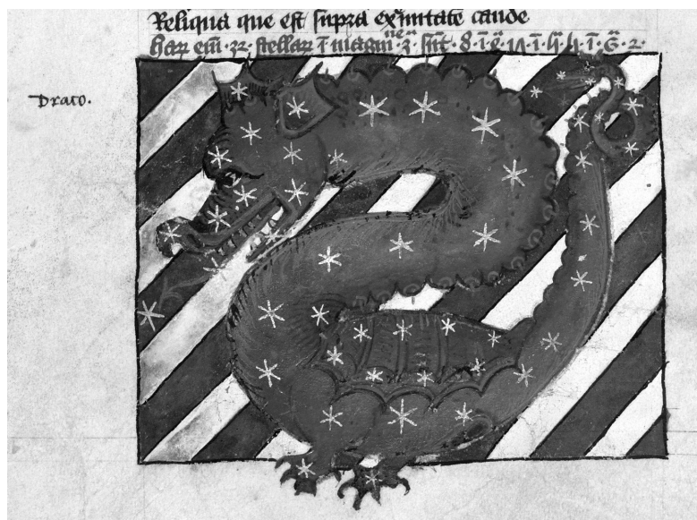
Рис. 4. Миниатюра с изображением созвездия Дракона из «Каталога Звезд».