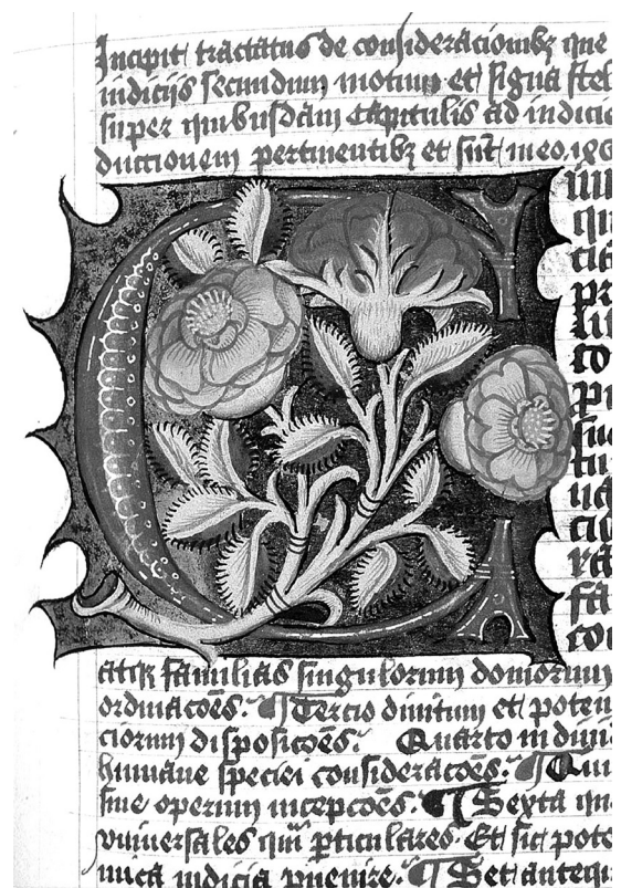
Рис. 1. Иллюминированная заглавная буква “С” с алыми розами (Guido Bonatti. Decem tractatus astronomiae // Arundel MS. 66. F. 187. British Library. The Catalogue of digitized manuscripts of British Library. URL: https://www.bl.uk/catalogues/illuminatedmanuscripts/ILLUMIN.ASP?Size=mid&IllID=7024 (дата обращения: 26.08.2019))

Представляет интерес еще одно изображение – дерево, увенчанное короной (иногда цветущее или с плодами в кроне), встречающееся также в качестве символа и герба Генриха VII в витражах Вестминстерского Аббатства (ок. 1515 г.) и Капеллы Королевского колледжа в Кембридже (ок. 1526 г.). В манускрипте «Зеркало дам» (“ Miroir des